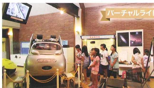
バーチャルライド